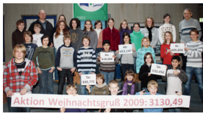
Kopfrechner gefragt: Die Einzelergebnisse und die Gesamtspende des „Weihnachtsgrußes“ können sich sehen lassen.

Bad Salzungen. Zugunsten der Deutschen Lepra- und Tuberkulosehilfe haben die fünften und sechsten Klassen des Gymnasiums Aspe 3130 Euro eingesammelt. Im Rahmen der „Aktion Weihnachtsgruß“ verkauften die Schüler fair gehandelte Geschenke und Kerzen im Familien- und Bekanntenkreis.