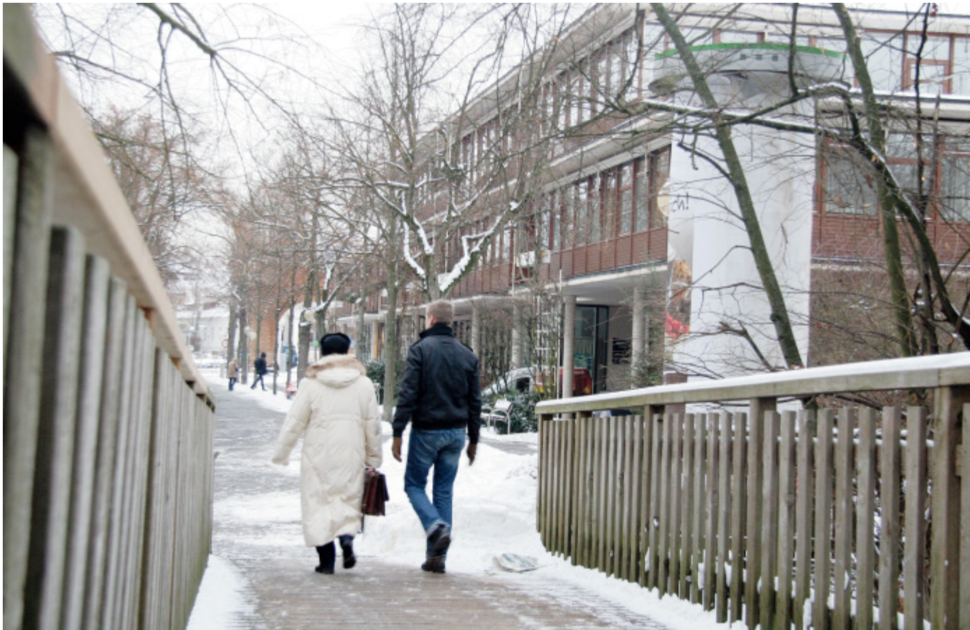
Naheliegende Lösung: An dem zum Verkauf stehenden Kurgastzentrum zwischen der Bleichstraße und dem „Roten Platz“ zeigt ein Bad Salzunger Investor Interesse.

Das Grundkonzept, das der Stadt mit dem Angebot vorliegt, sieht auch eine mögliche Erweiterung zum „Roten Platz“ hin vor – möglicherweise als Überdachung des Sprudels. So kommen mehr als 5000