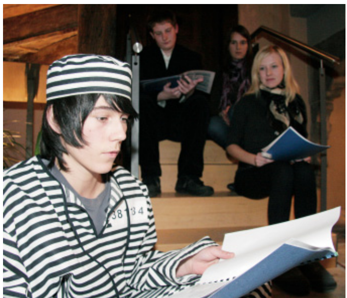
Ergreifend: Nachdenklich stimmt das Auschwitz-Gedenken gestern Abend in der Schötmaraner Begegnungsstätte.