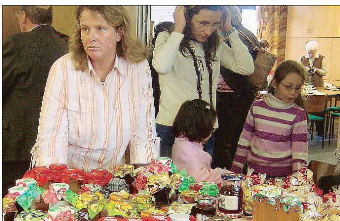
Hausgemacht und begehrt: Leckere Marmelade ging beim Basar reichlich über die Standtische.