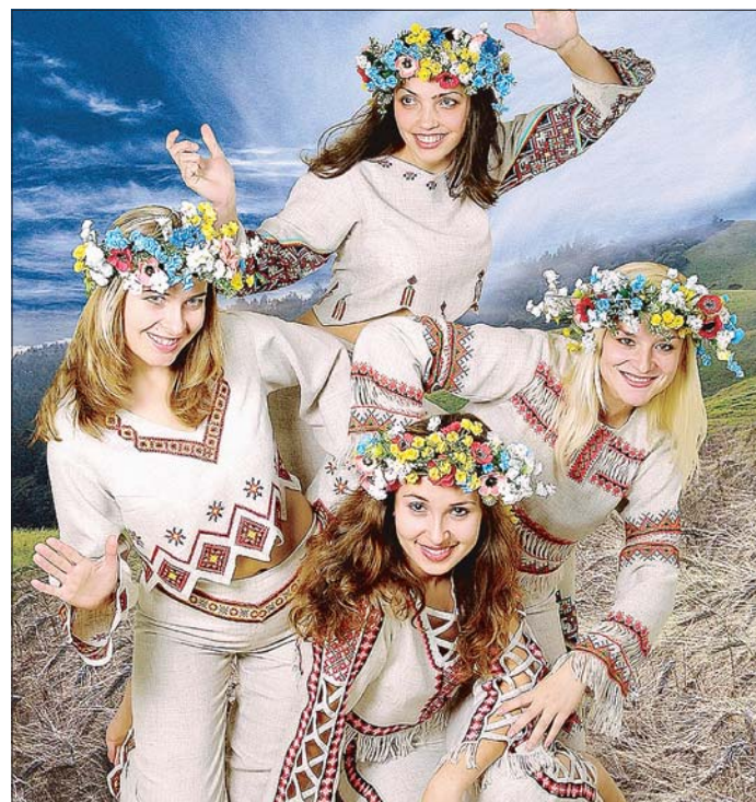
Apart: Auch das Frauenquartett „Nota-Neo“ ist in den kommenden Tagen auf mehreren Konzerten zu hören.

■ Bad Salzuflen. Ukrainische Musikerinnen und Musiker sind wieder in Lippe zu Gast und treten während der Adventszeit bei verschiedenen Veranstaltungen oder Gottesdiensten auf. Auf Einladung des Vereins „Brückenschlag Ukraine“ stellen sich das Bandura-Trio „Leliya“, das Frauenquartett „Nota-Neo“ und die Volksmusikgruppe „Terlytsch“ vor.